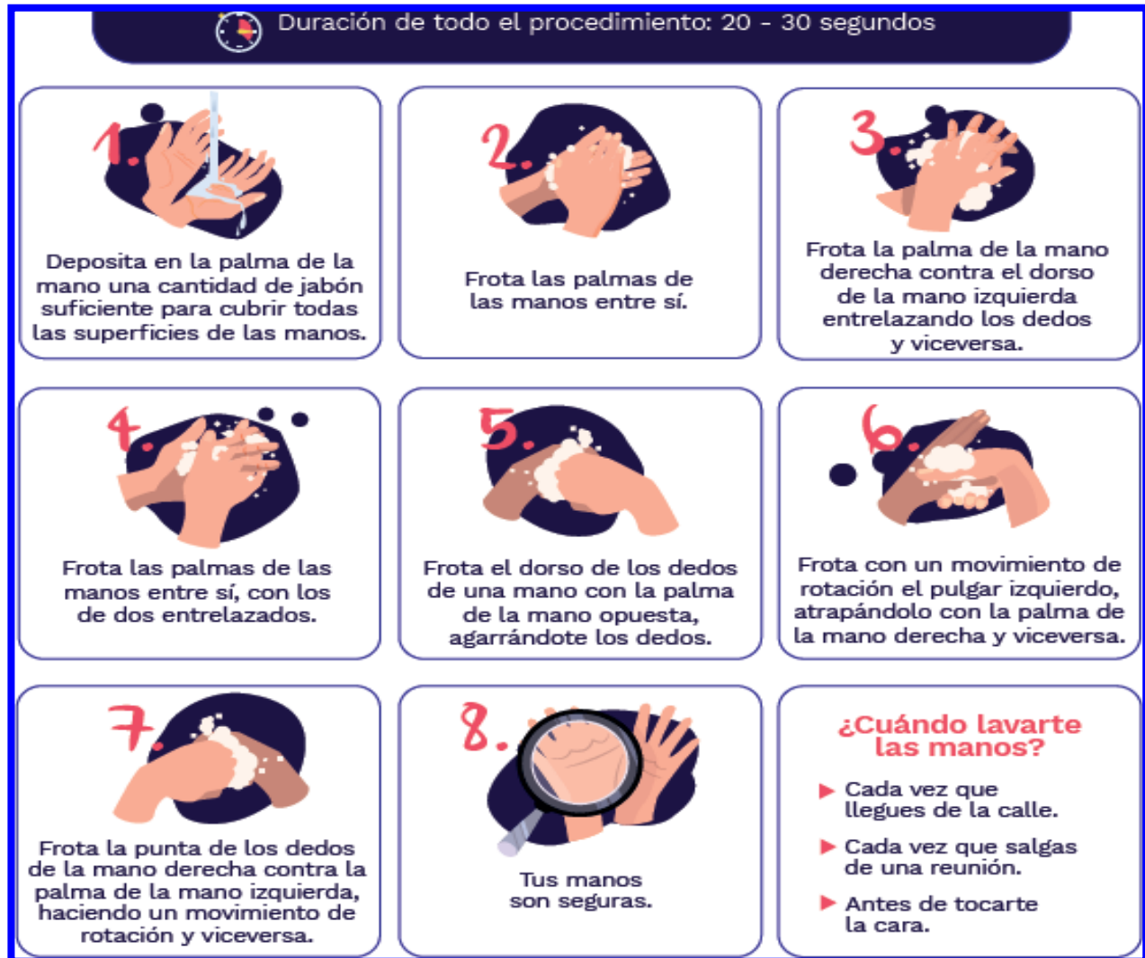
Imagen No. 4: Ficha lavado de manos Ministerio de salud y Protección Social