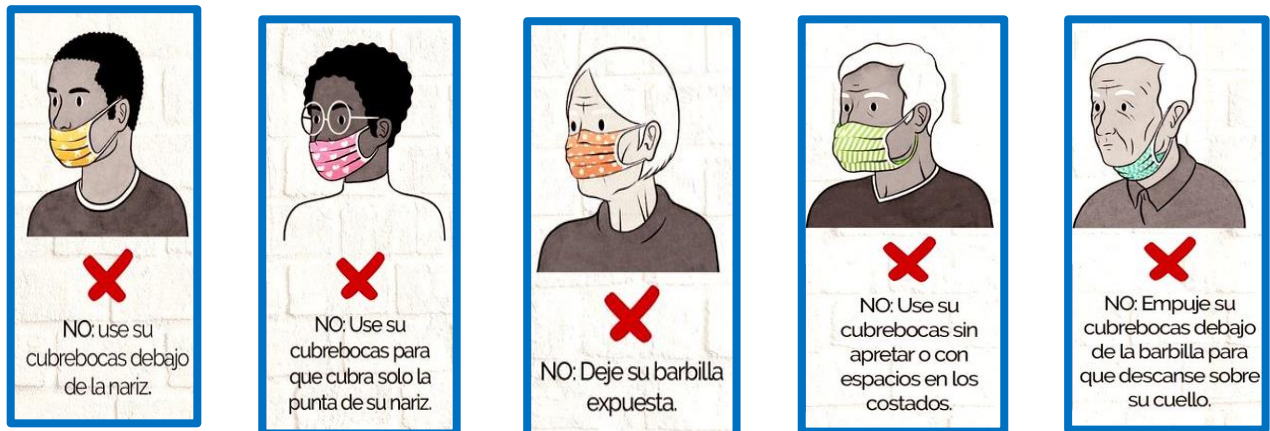
Imagen No. 3 Indicación Tapabocas NY times