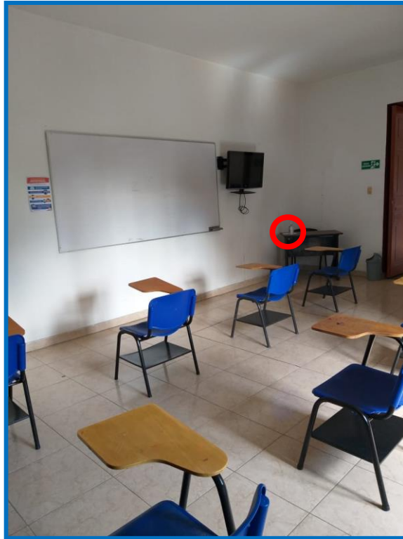
Imagen No. 1 con distanciamiento social en aula o laboratorio de práctica e investigación