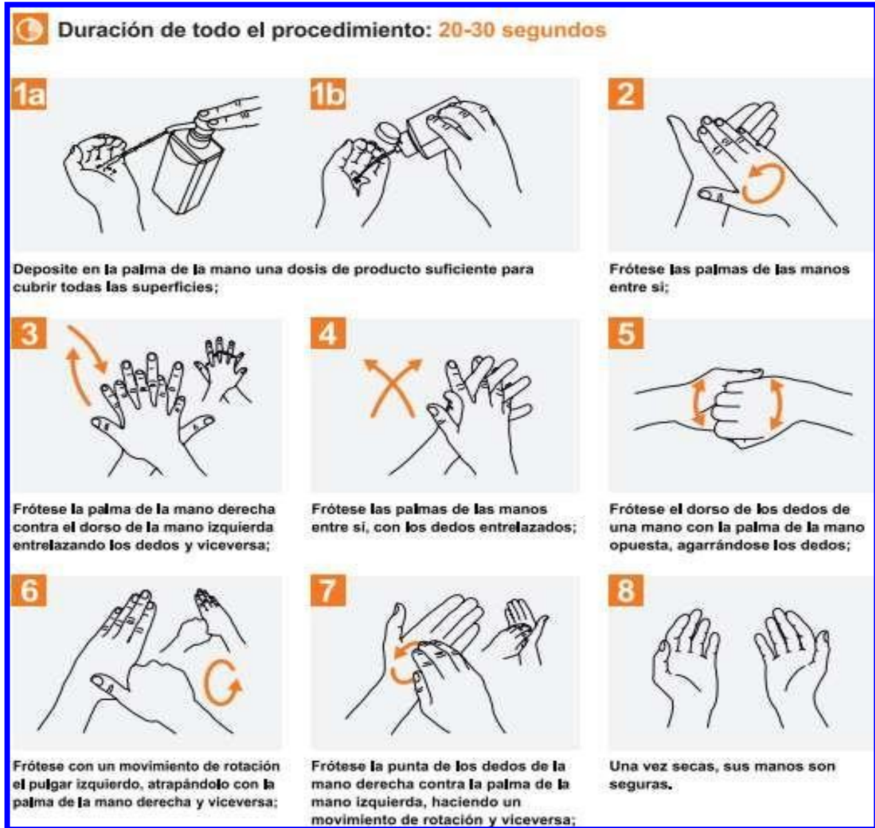
Imagen No. 5. Técnica de implementación de manos

La higiene de manos con alcohol glicerinado se debe realizar siempre y cuando las manos están visiblemente limpias. El uso de gel glicerinado no reemplaza el lavado de manos.