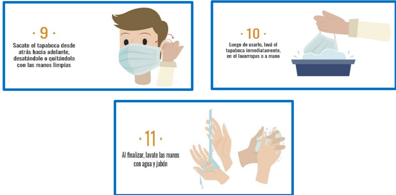
Imagen No. 2: Uso correcto del tapabocas